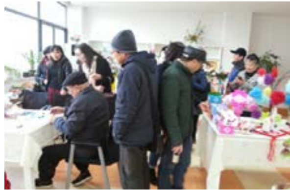
(党员同志们参观福利院手工制作室)

为认真贯彻党章要求和《中国共产党廉洁自律准则》等党内规章，深入贯彻习近平总书记系列重要讲话精神，特别是关于“三严三实”专题教育的重要指示，紧紧围绕“严以修身、严以用权、严以律己，谋事要实、创业要实、做人要实”主题，2015年12月11号下午图书馆第二第三支部联合开展了走访福利院，关爱孤残老人和儿童的献爱心活动，根据福利院院长建议带去了他们所需的柔湿巾、小毛巾等日用品，切切实实为孤残老人和孩子送去一份爱心。