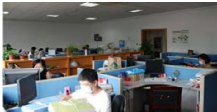
数字化建设部工作人员，利用暑假，戴着口罩，逐本核对论文

我校博硕士学位论文数量较多，从早期的江苏师院，以及后来合并的苏州丝绸工学院、苏州医学院，收藏了很多博硕士学位论文，这些论文分布在图书馆、档案馆，甚至有些已经散落，无法系统查找。