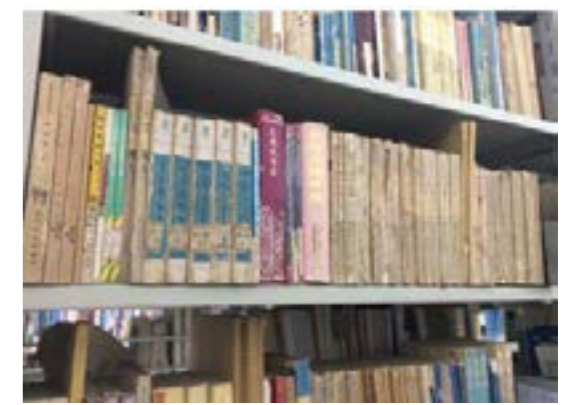
艾尔肯尼莎当年用过的专业图书