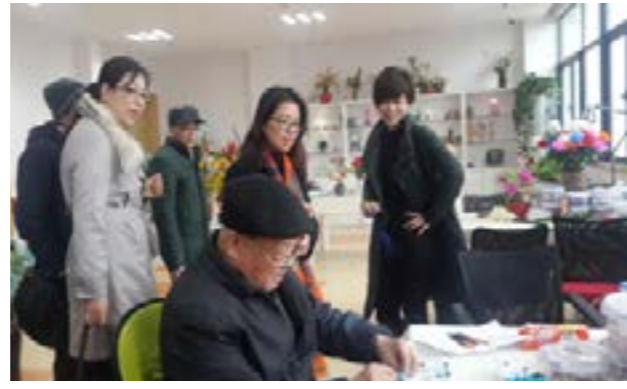
(福利院老人在制作手工艺品)

苏州市社会福利总院是2010年苏州十大民生实事工程之一，是为贯彻落实市委、市政府加快发展苏州社会福利事业，大力改善和提高孤老、孤儿、孤残人员养育护理水平，提升苏州城市形象的一项重大举措，更是苏州历史上建设规模最大的民政公共服务设施项目。新建成的总院，集养（育）护、康复、医疗、教育、学习、技能培训等于一体，是目前全国范围内唯一一所收养收治政府供养的无家可归、无依无靠、无生活来源的孤老、残幼、精障等“三无”人员的现代化、综合性社会福利服务机构。